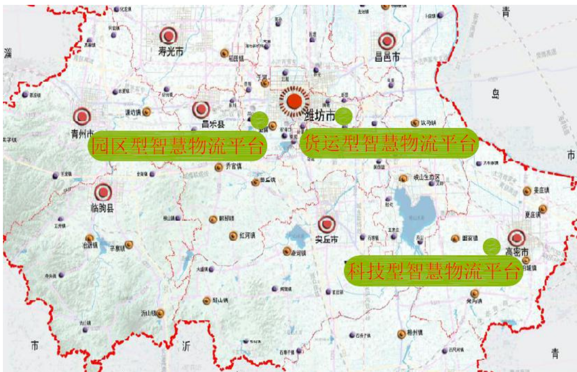
图 3-1 智慧物流平台分布图